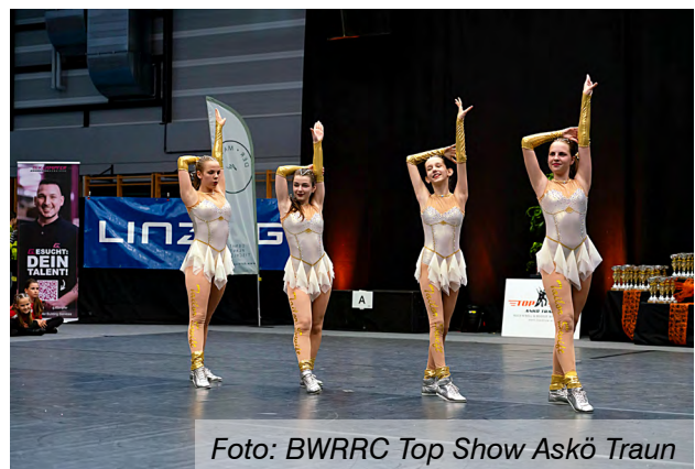
Top Show Askö Traun

sich die ROCK ANGELS (RRC Rockstars), die mit dem 2. Platz ihre beste Platzierung ertanzten.